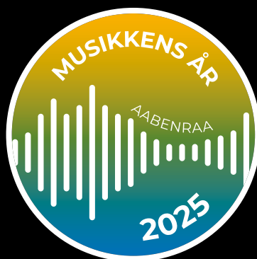
Primære logo – negativ