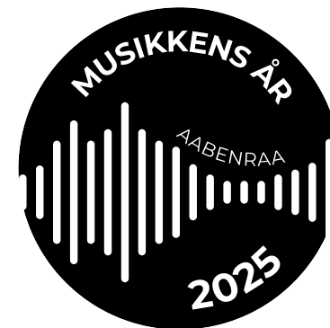
Primære logo – sort