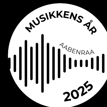
Primære logo – hvid