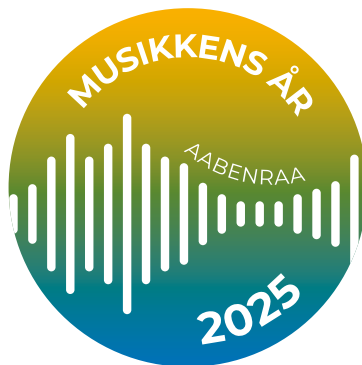
Primære logo – positiv

Logoets positive variant bruges på lyse baggrunde, mens logoets negative variant bruges på mørke baggrunde. Den sorte og hvide version bør kun anvendes hvor de farvede varianter ikke er mulige at anvende.